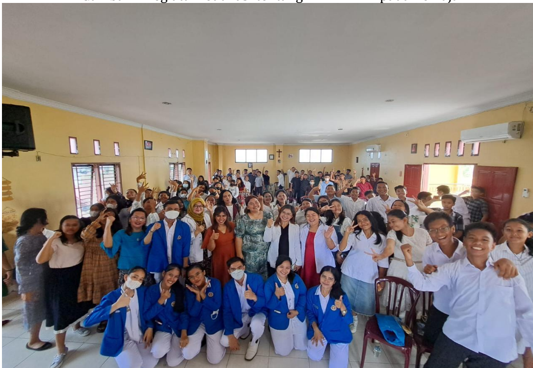
Gambar 3: Kegiatan Foto Bersama Remaja GBKP KM * Medan