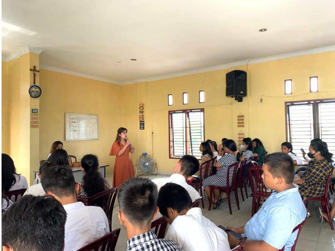
Gambar.1 Kegiatan edukasi tentang TRIAD KRR pada Remaja

dan tekanan teman sebaya. Oleh karena itu, intervensi lanjutan yang melibatkan keluarga dan komunitas sangat diperlukan untuk mempertahankan dan memperkuat perubahan sikap ini.