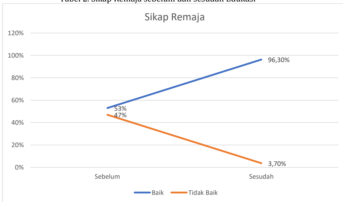
Tabel 2. Sikap Remaja sebelum dan sesudah Edukasi

Kegiatan edukasi yang dilakukan berhasil meningkatkan sikap positif remaja terhadap Triad Kesehatan Reproduksi Remaja (Triad KRR). Sebelum diberikan edukasi, hanya 41% remaja yang menunjukkan sikap baik, sementara 59% sisanya memiliki sikap yang kurang baik terkait kesehatan reproduksi. Setelah pelaksanaan edukasi interaktif, terjadi peningkatan signifikan dengan 92,7% remaja menunjukkan sikap yang baik dan hanya 7,3% yang masih memiliki sikap tidak baik.