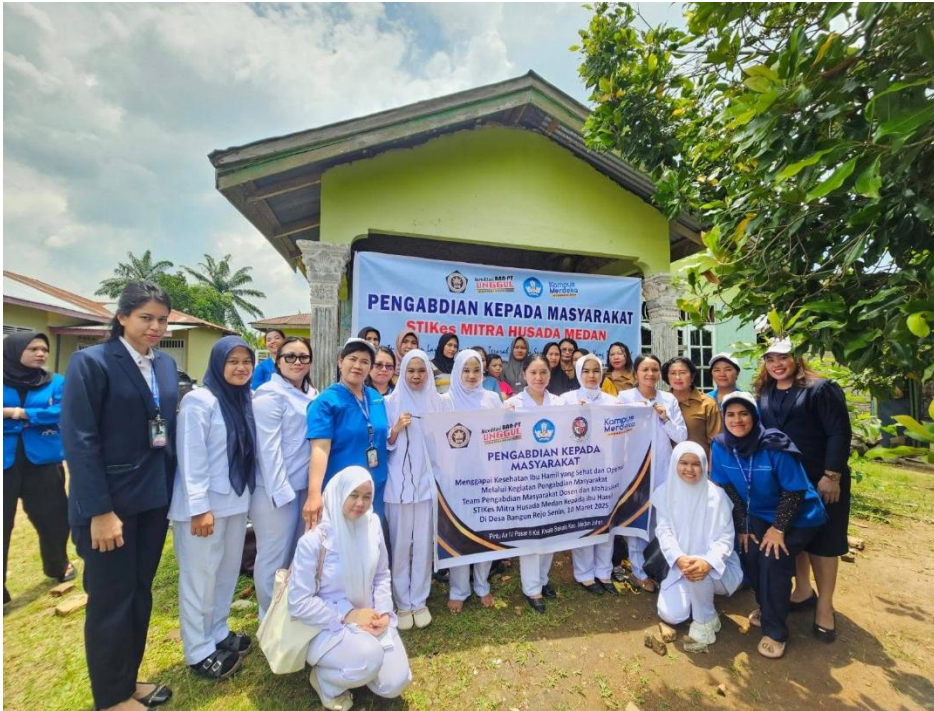
Gambar 3: Kegiatan Foto Bersama Ibu Hamil, Kader dan Bidan Puskesmas